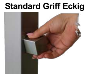
Standard Griff Eckig