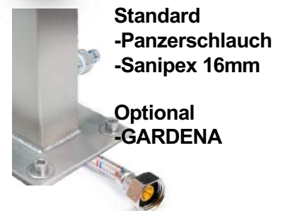
Standard -Panzerschlauch -Sanipex 16mm